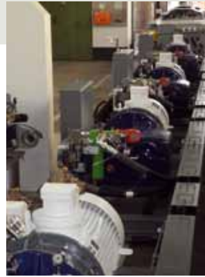
International erfolgreich ist Hauhinco im untertägigen Bergbau, wo die Hochdruckpumpen in Pumpenzügen und Bedüsungstationen eingebaut werden.

anderer Hersteller dieselbe Durchgängigkeit bis an die Maschine bieten konnte. Für die Anbindung der Produktion sorgt die Zusatzsoftware Shop Floor Connect (SFC) vom Siemens Solution-Partner A+B Solutions, die den Anwendern in der Werkstatt über eine Weboberfläche den direkten Zugriff auf die in Teamcenter gespeicherten fertigungsrelevanten Daten, wie z. B. NC-Programme, Werkzeuglisten, Fertigungsdokumentationen und 3D-Modelle ermöglicht.